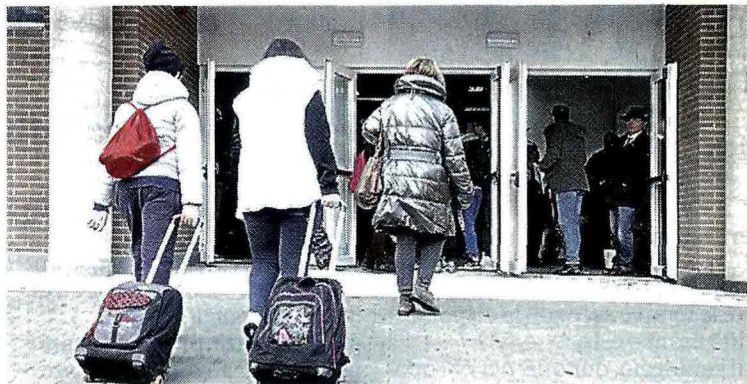
SPESE Le scuole sono spesso in emergenza

SOLDI PER FOTOCOPIE E CARTA IGIENICA LA CGIL DENUNCIA: «ALCUNI PRESIDI FANNO PRESSIONE SU CHI NON PAGA»