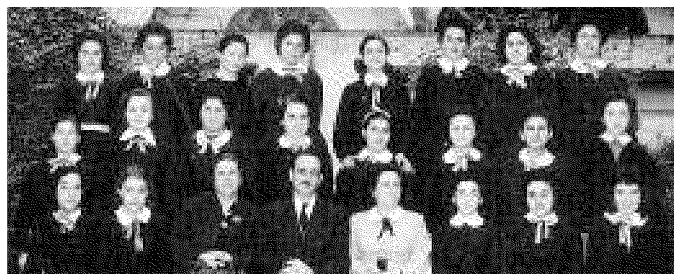
La classe III B dell'anno scolastico 1955/1956