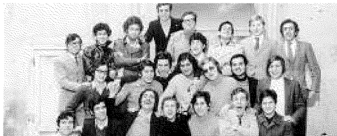
La IV A (1969-1970): secondo in basso da sinistra Marcello D'Orta