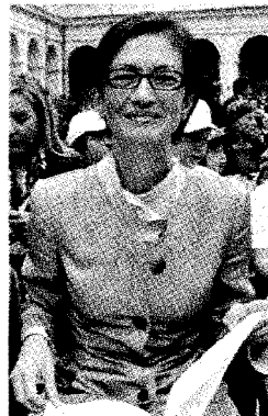
Il ministro Mariastella Gelmini. In alto a destra, Napolitano applaudito ieri dagli studenti